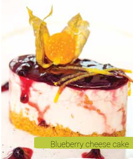
Blueberry cheese cake